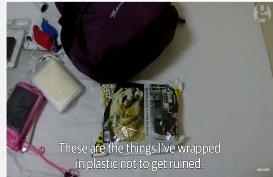
Escape from Syria: Rania's odyssey