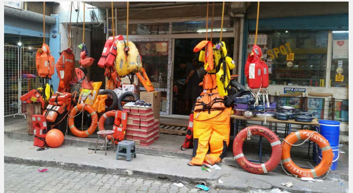
Izmir, Türkei (2016)

→ Ambivalenz von Dingen (Boot, Rettungsweste)