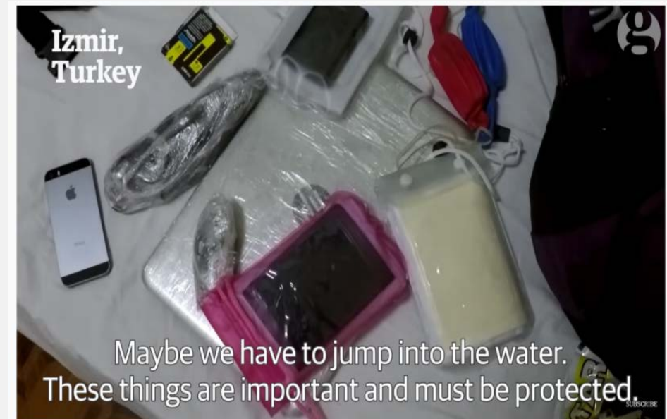
Escape from Syria: Rania's odyssey